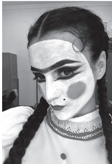
В образі Сони з «Хануми»

«Тоді рухнув мій фундамент – базове відчуття безпеки. Брат, маючи інвалідність, пішов добровольцем у ЗСУ. Мій дід забрали росіяни... Загалом історія з окупацією Василівки резонує з