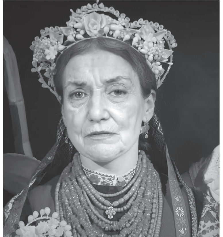
Кадр із заставки до серіалу «Баба Єлька», штучно зістарена актриса